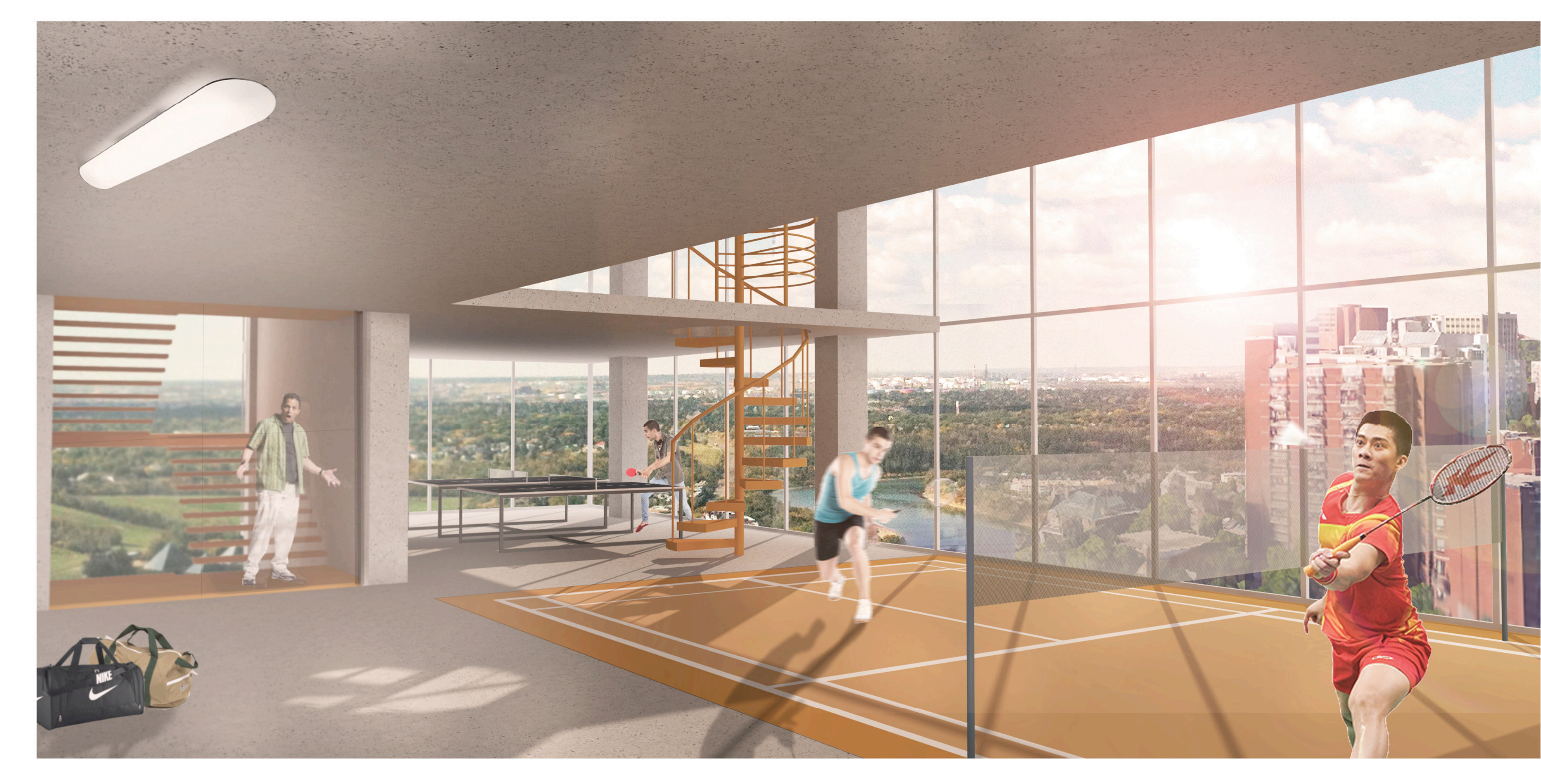
Vue sur la rivière du gym